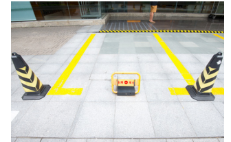
Özel otopark yönetimi