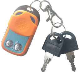
Kontrol Kumandası ve Anahtarlar